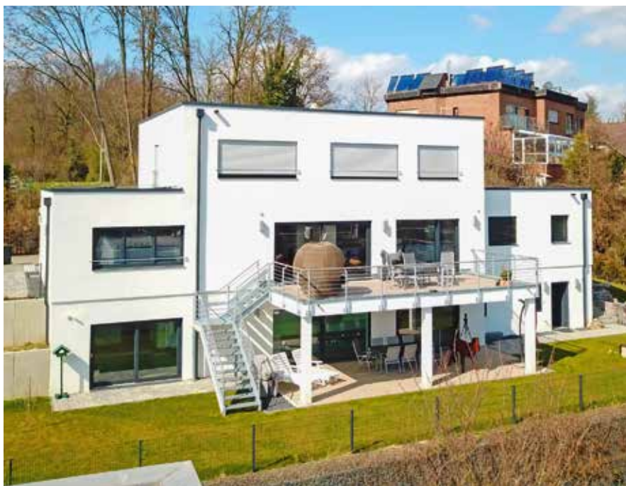
Baufamilien können Zeit und Aufwand sparen, wenn sie auf ein eingespieltes Team aus Kellerbaufirma und Fertighaushersteller setzen.