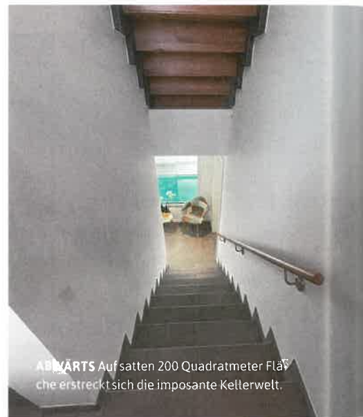
ABWÄRTS Auf satten 200 Quadratmeter Fläche erstreckt sich die imposante Kellerwelt.