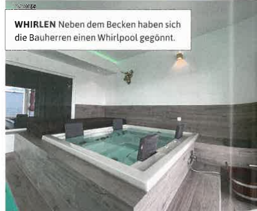
WHIRLEN Neben dem Becken haben sich die Bauherren einen Whirlpool gegönnt.