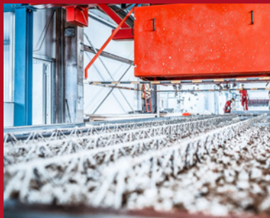
4. Automatisches Betonieren der jeweiligen Elementwandschale