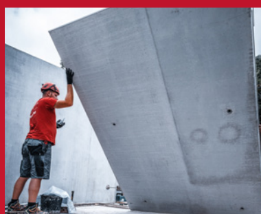
2. Versetzen der Kellerinnenwände