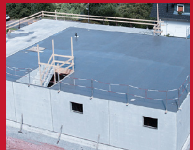
6. Fertig! Der frisch betonierte Glatthaar Keller