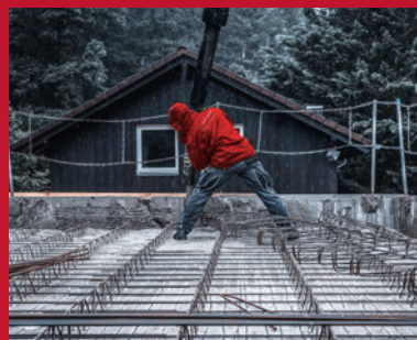
5. Betonage der Kelleraußenwände und -decke