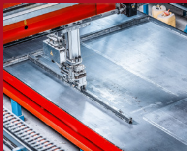
2. Einlegen der Schalung auf dem Schalungstisch