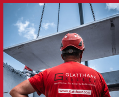
3. Verlegen der Filigrandecke