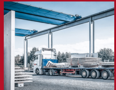
6. Verladung der fertig betonierten und ausgetrockneten Elementwand