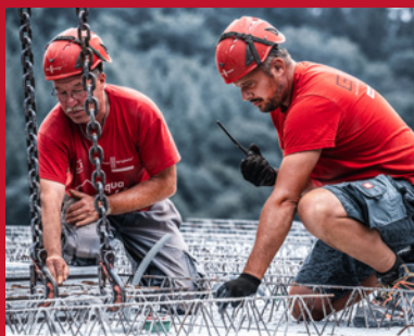
4. Verlegen der oberen Deckenbewehrung