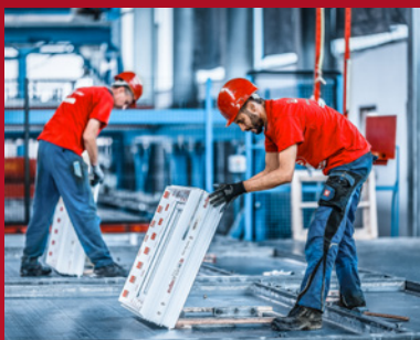
1. Einlegen der Einbauteile (Fenster, usw.) auf dem Schalungstisch