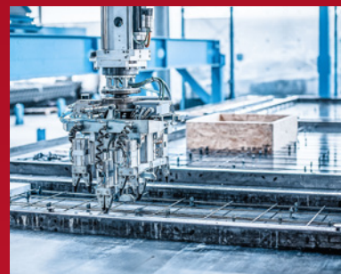
3. Einlegen der Bewehrung auf dem Schalungstisch