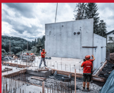
1. Versetzen der Kelleraußenwände