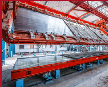
5. Verbinden von Innen- und Außenschale der Elementwand